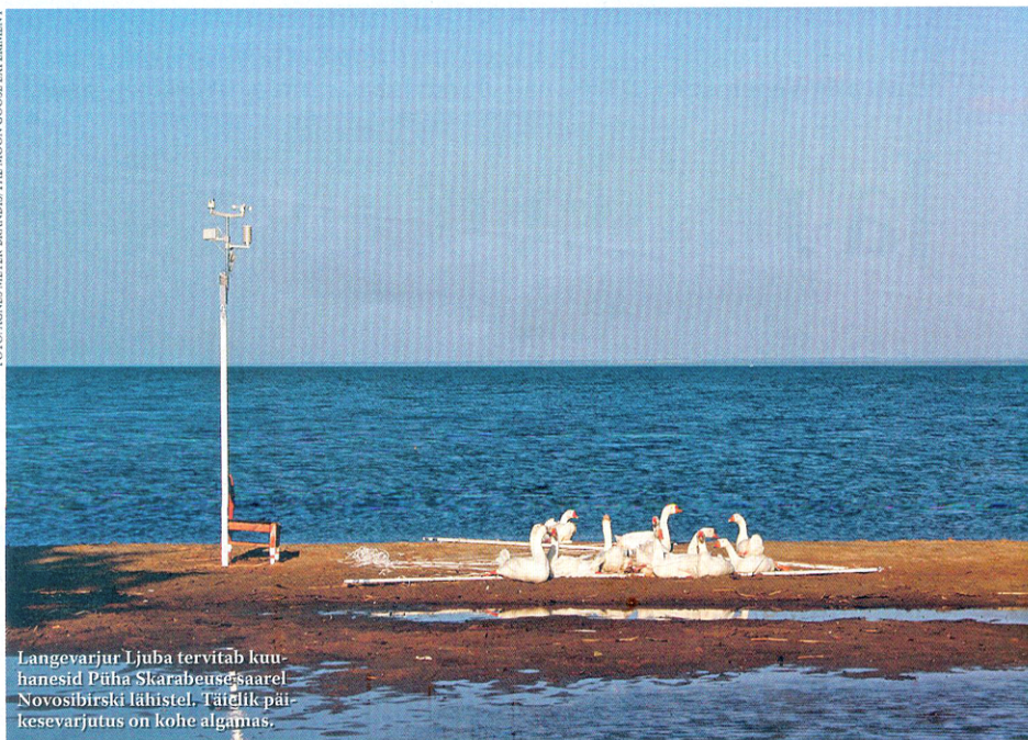
Langevarjur Ijuba tervitab kuuhanesid Püha Skarabeuse saarel Novosibirski lähistel. Täielik päikesevarjutus on kohe algamas.