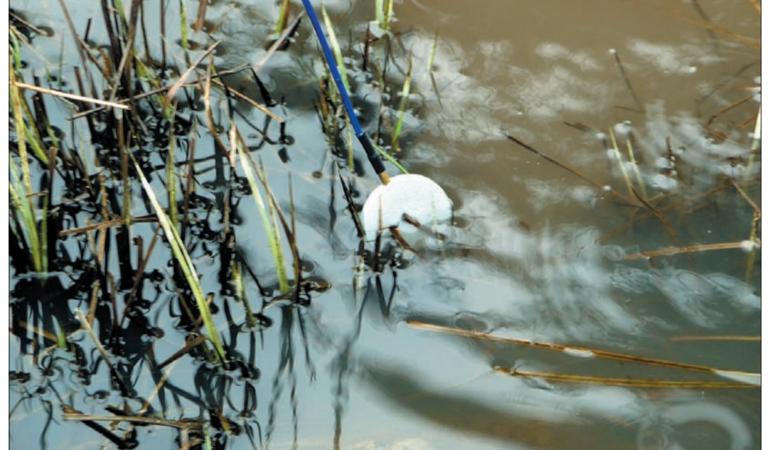
Hydrofoni eli vedenalainen mikrofoni rantavedessä.