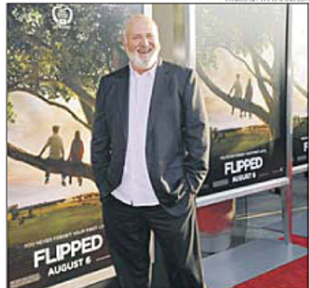
Ohjaaja Rob Reiner oli paikalla elokuvansa Flipped ensi-illassa.