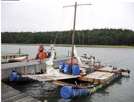
Pelastuslautta Silakka.