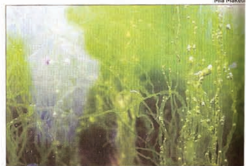
Levä voi olla myös kaunista.

-Minulle meri ja yleensäkin vesi elementtinä on ollut aina suuri innoittaja, mutta vasta