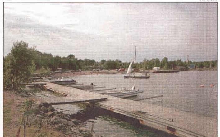
Näyttävä rantautuminen Hakkenpäässä.